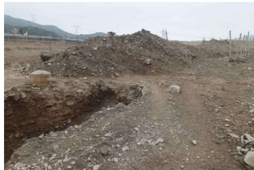
ZONA COLMATADA QUEBRADA LUCUMO